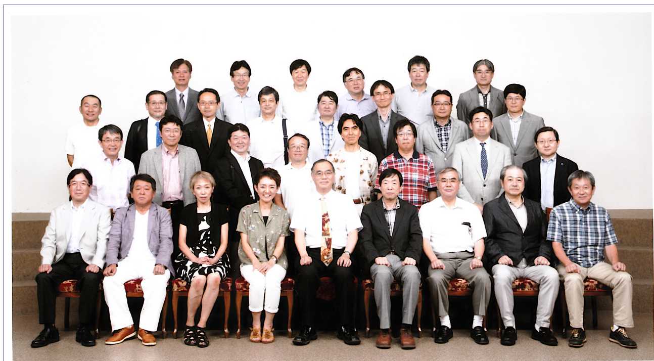
宮崎医科大学医学部53年組/5期生同窓会 平成26年8月23日 於 ニューウェルシティ宮崎