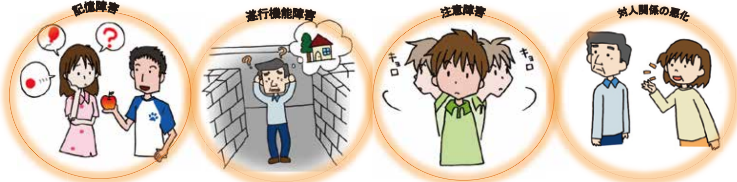
※高次脳機能障害とは、交通事故、脳梗塞や脳出血などで脳に損傷を受けたため、記憶や感情などに障害が起きた状態です。

第7回宮崎リハビリテーション講習会「高次脳機能障害に対する考え方と対応及び当事者となった専門家の立場から社会復帰に向けた取り組みについての講習会」を下記要領にて開催いたします。リハビリテーション関係者、行政職員だけでなく、高次脳機能障害の当事者・御家族の方々など皆様のご参加をお待ち致しております。 宮崎リハビリテーション講習会実行委員長 帖佐 悦男