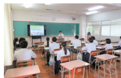
宮崎県立高千穂高等学校

①医学部で学ぶこと ～医師になるために必要なこと～ ②宮崎大学医学部医学科地域枠入学制度