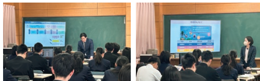
宮崎県立宮崎大宮高等学校