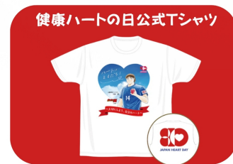
心臓病啓発アンバサダー『三杉淳』イラスト入り