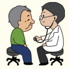
健診会場にモニター心電図を設置することで、他県にない宮崎モデルの構築をめざします