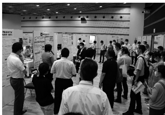
企業、大学間のマッチングを目的として令和4年7月に宮崎大学と共に開催した「ものづくりフェスタ」の様子