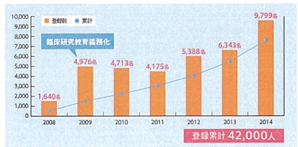
サイト登録者推移